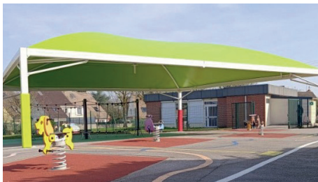
Préau type qui sera installé cet été

Afin d'offrir de meilleures conditions d'accueil aux élèves, la ville va procéder cet été à l'installation d'un préau dans la cour de l'école élémentaire de la Forêt. Cet équipement répond à un double objectif : protéger les enfants des fortes chaleurs grâce à son rôle d'ombrière et leur offrir un abri en cas de pluie.