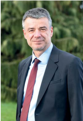
Yannick BORDE Maire