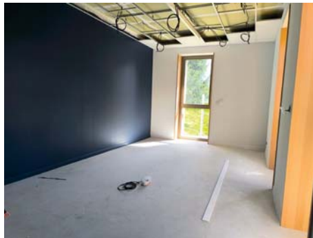
Future salle de réunion à l'étage

Les travaux de l'Hôtel de Ville avancent conformément au calendrier établi. Actuellement, les opérations de second œuvre se poursuivent activement : pose des cloisons en placo, installations électriques et de plomberie, travaux de peinture, carrelage et mise en place de la ventilation. Des panneaux solaires seront également installés dans les prochaines semaines, avant la réalisation des revêtements de sol en toute fin de chantier. Parallèlement, les aménagements intérieurs se précisent