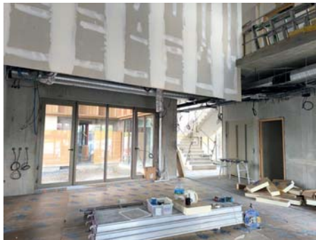
Futur hall d'accueil