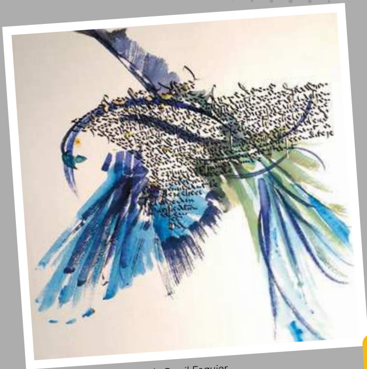
"L'oiseau de la vérité" Paule Persil Faguiier Expo du 14 au 28 septembre 2019 (cf p.11)

La culture est un antidote à la violence car elle nous invite à la compréhension d'autrui et féconde la tolérance en nous incitant à partir à la rencontre d'autres imaginaires.